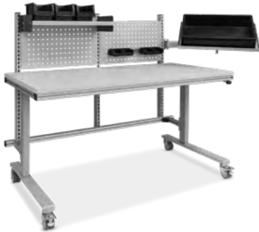
Montagetisch fahrbar mit niedrigem Aufbau für Ablageboden und Lochblech, inkl. Schwenkarm für Behälterablage