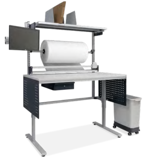
Packtisch mit hohem Aufbau, Schneidevorrichtung, Ablage für Kartonagen und Schwenkarm für Bildschirm