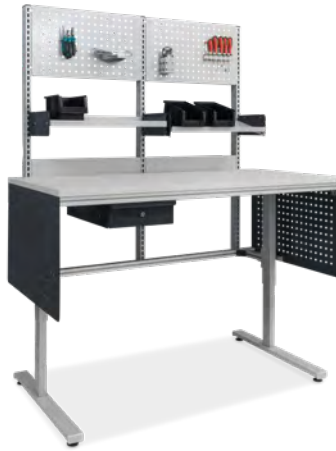
Montagetisch mit hohem Aufbau für Ablageboden und Lochblech, inkl. Einzelschublade und seitlichem Klemmschutz