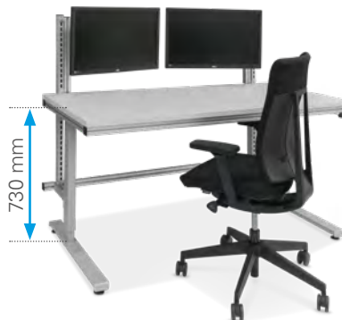
Einfacher Arbeitsplatz für Avor, Lager oder F&E mit zwei Schwenkarmen für Bildschirme